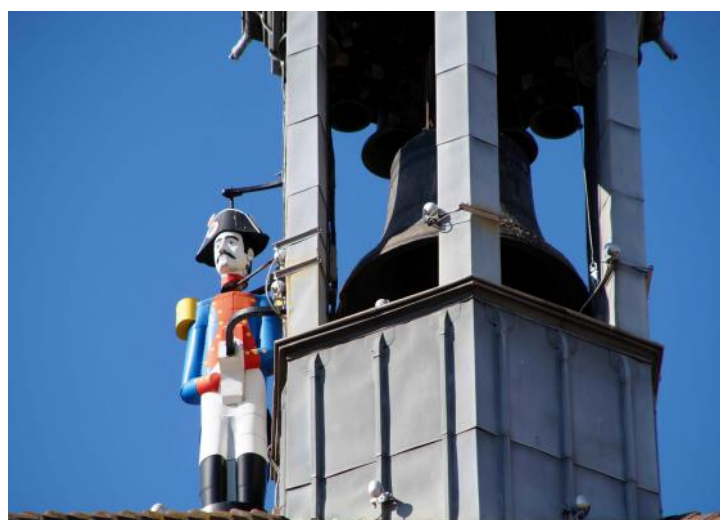
Romans-sur-Isère – Le jacquemart