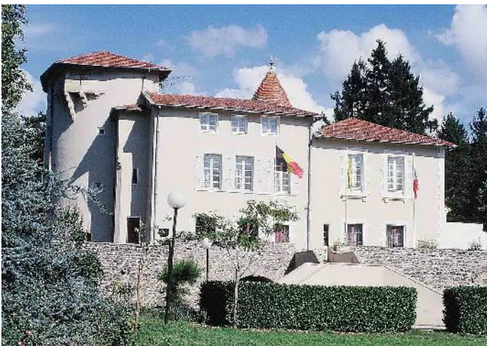
Le château de Collonges