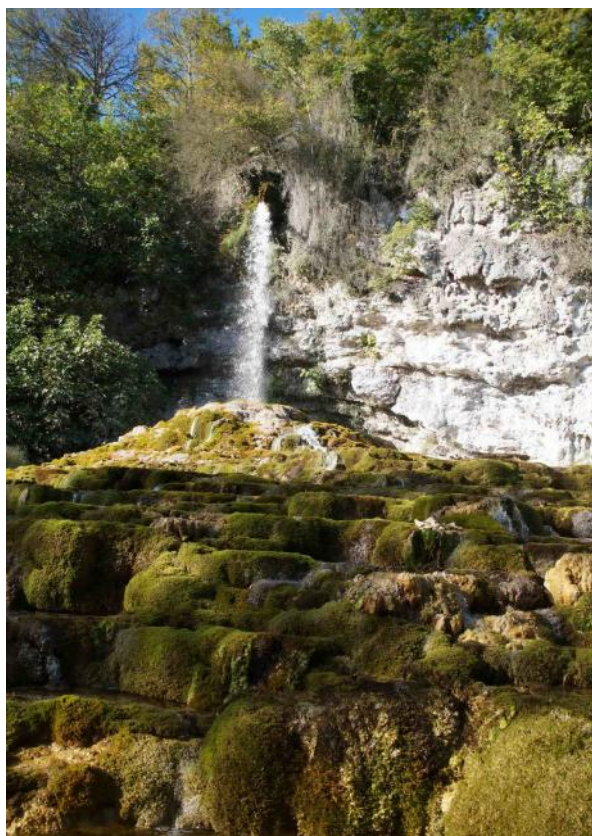
Au jardin des Fontaines pétrifiantes