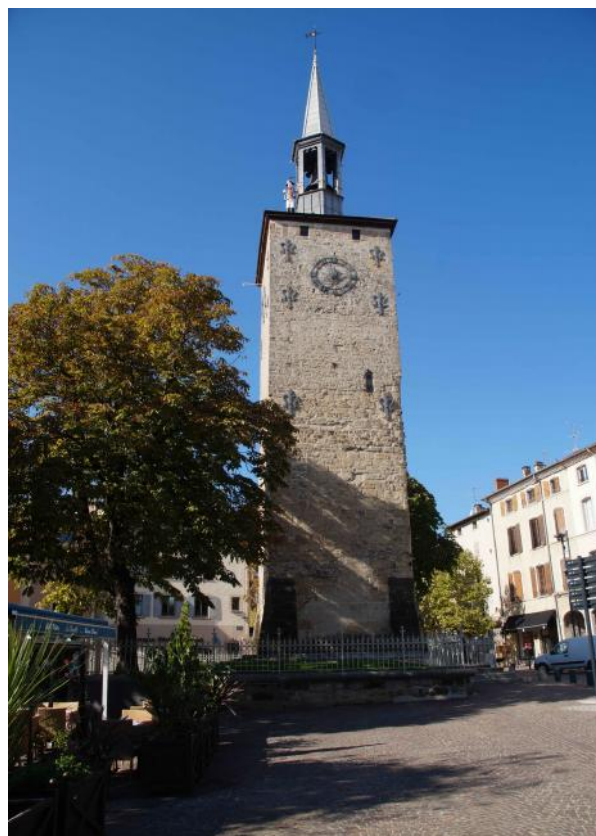
Romans-sur-Isère – Le beffroi