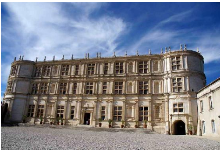
Le château de Grignan