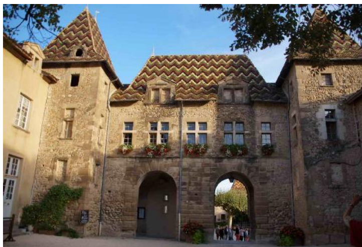
À l'abbaye Saint-Antoine