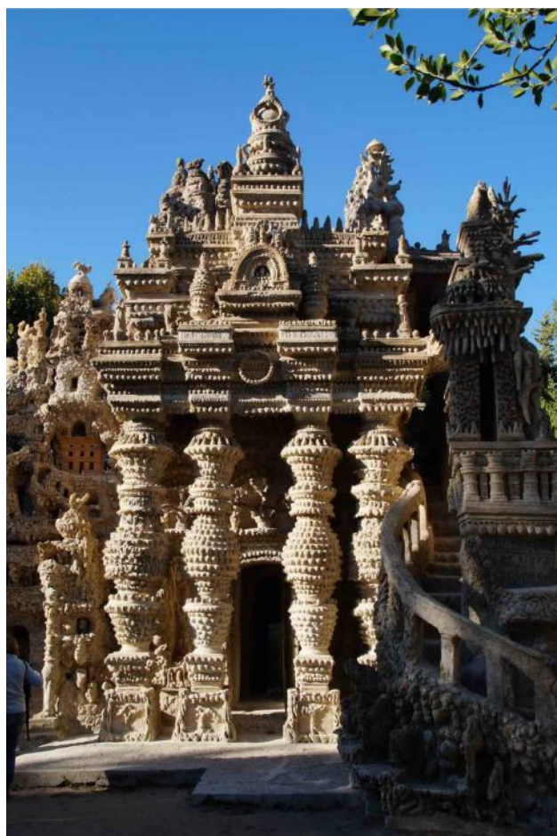
Palais idéal du Facteur Cheval